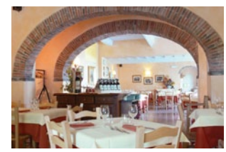
イタリア本国のレストランテ・バディア・ア・コルティブオーノ

仕入状況により内容が一部変更になる場合がございますので、予め御了承くださいませ。